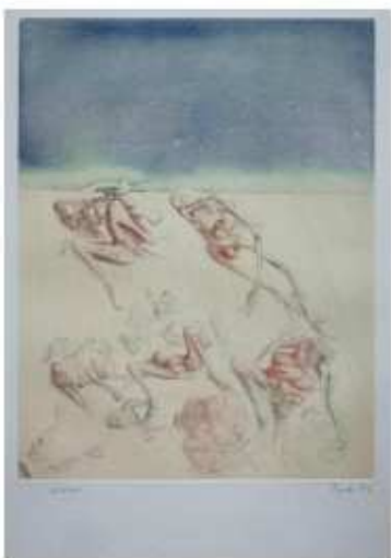
Monténégro I , 1973

Pointe-sèche sur papier, 76x56 cm, 76 x 56 cm, courtesy Alain Controu