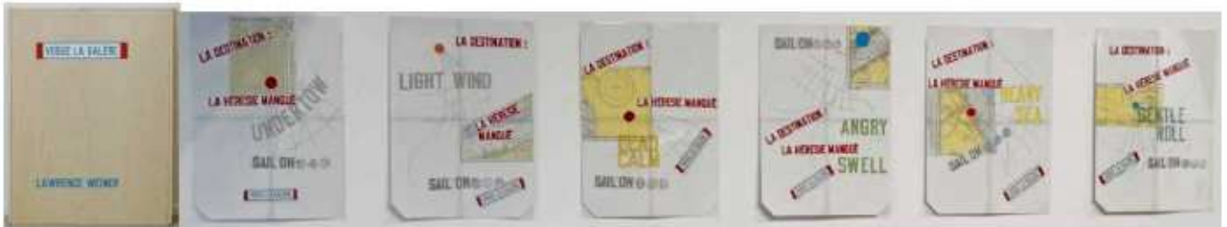
Lawrence Weiner, Vogue la galère , 2009

Multiple d'artiste daté et signé, numéroté sur 20, Édition, 6 impressions, 60 x 45 cm chaque, courtesy Bernard Chauveau Éditeur, Paris