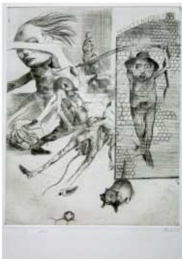
Néant , 1970

Pointe-sèche sur papier, 76 x 56 cm